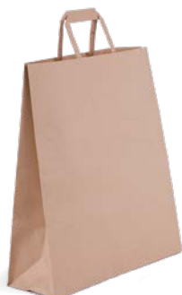
36 + 12 x 41 cm