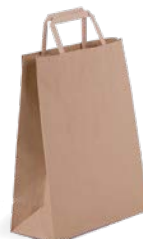
22 + 10 x 29 cm