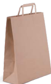
26 + 11 x 34 cm