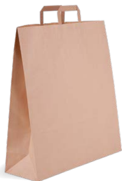
45 + 15 x 50 cm